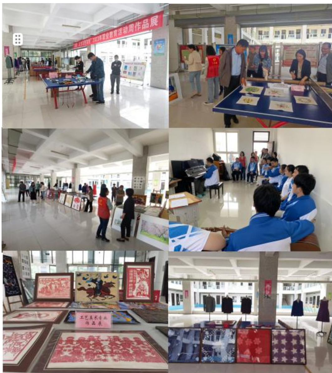
图 3-3 校园开放日

2023年5月，学校开展以“技能：让生活更美好”为主题的校园开放日活动。校园开放日吸引了陈仓区科技工业园区、东关街道科技园区社区等社会人士到场，来校嘉宾参观了学校各专业展出的作品、参观了学校社团活动，此次活动让全社会多方位了解了职业教育的特色与魅力，营造人人皆可成才、人人尽展其才的良好氛围，提升了学校的社会影响力。