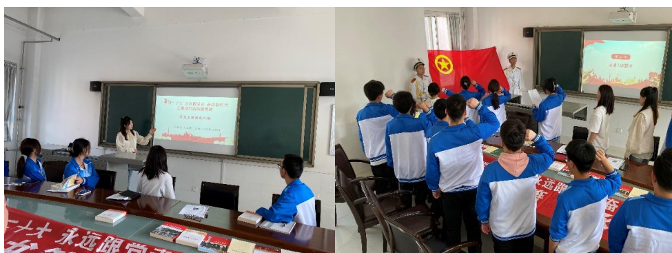
图 2-8 “阅读红色书籍，传承红色精神” 主题团日活动

为了充分发挥红色基因铸魂育人的积极作用，引领全体团员青年了解红色经典，汲取红色营养，激发团员青年爱国、爱党热情，学校团委组织全体团员开展学习二十大、永远跟党走、奋进新时代“阅读红色书籍，传承红色精神”主题团日活动。通过阅读红色书籍，使大家了解历史，缅怀过去，传承未来，通过大家的探讨和交流，从红色经典中汲取了精神力量，陶冶了思想情操，营造了积极向上、健康文明、富有历史人文底蕴的校园文化氛围。