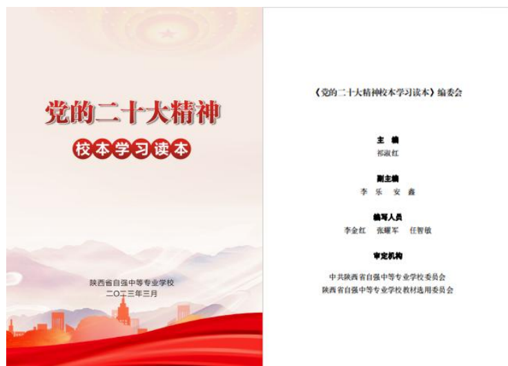
图 8-5 “党的二十大精神”校本学习读本