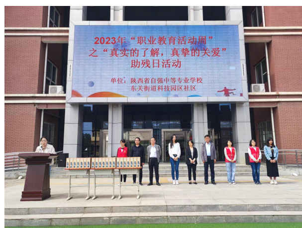
图 3-2 “真实的了解，真挚的关爱” 全国助残日活动

扶弱助残是中华民族的传统美德。2023 年 5 月，学校与陈仓区虢镇东关街道科技工业园区社区共同举办了 “真实的了解，真挚的关爱” 全国助残日活动。活动有助于在全社会形成尊重、理解、关心、帮助残障人士的良好氛围，提升残疾学生生活的幸福感与获得感。