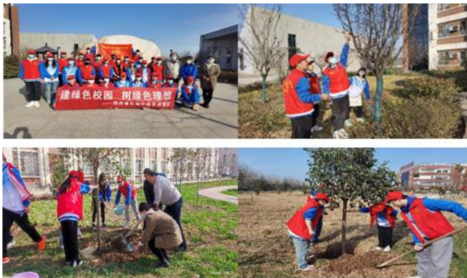
图 3-9 “爱绿、护绿、撒绿，共建、共护、共享” 植树节活动