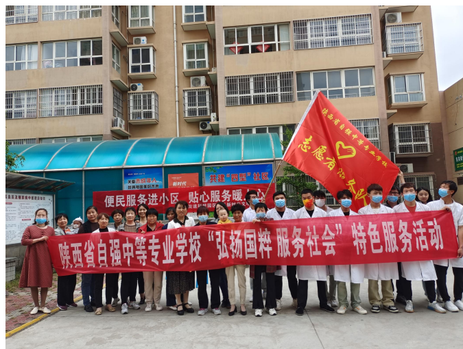
图 3-4 “弘扬国粹、服务社会”特色服务活动

2023年5月25日，学校联合陈仓区东关街道科技工业园区社区开展“弘扬国粹服务社会”特色服务活动。师生深入陈仓区东关街道科技工业园区社区，就疾病预防、康复保健等问题对社区居民进行知识普及，并通过专业按摩手法有效缓解居民亚健康症状，共义务按摩服务逾六十余人次，得到了小区居民的高度赞扬和一致好评。