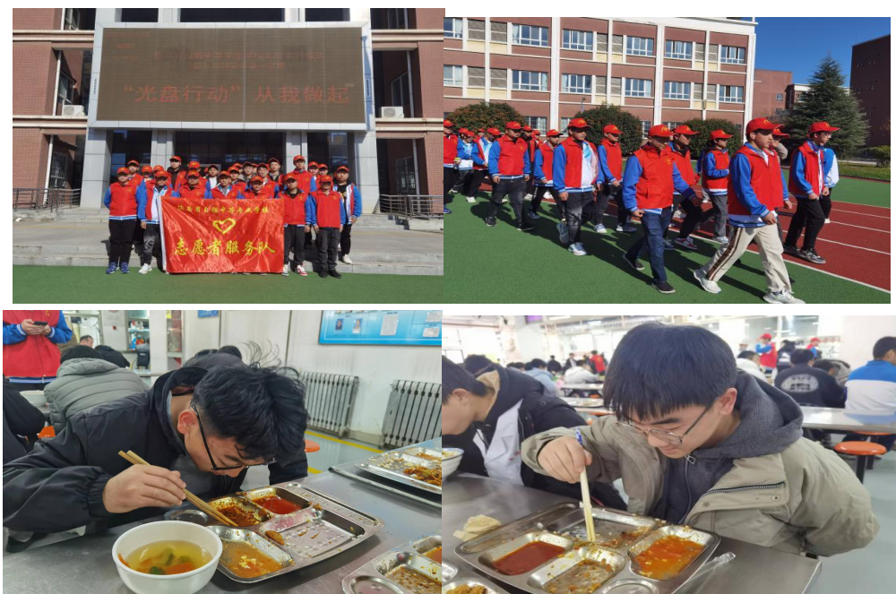
图 3-7 “光盘行动、从我做起” 志愿者服务活动

为进一步增强广大学生爱粮、节粮意识，提倡文明用餐的良好风气，学校组织我校学生志愿服务队开展了 2023 年弘扬传统美德 厉行勤俭节约系列活动之“光盘行动、从我做起”志愿者活动。