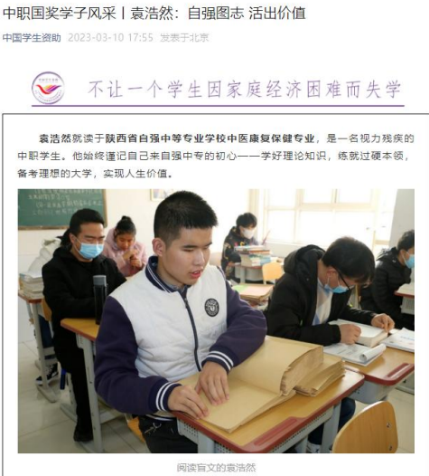
图 2-1 中职国奖学子风采“自强图志 活出价值”

2023 年学校报送的中职国家奖学金获奖学子风采录征稿文章“自强图志 活出价值”被全国学生资助管理中心采用，在“中国学生资助”微信公众号的登载。