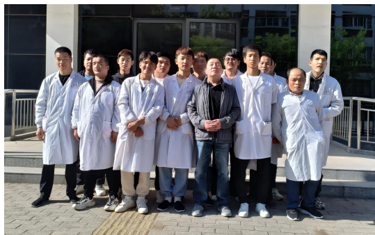
图 4-2 中医名师进校园

活动通过座谈交流、专题讲座、临床实践按摩手法交流等多种形式进行,让师生与名师面对面互动,近距离感受中医名师的魅力和中医文化的博大精深。