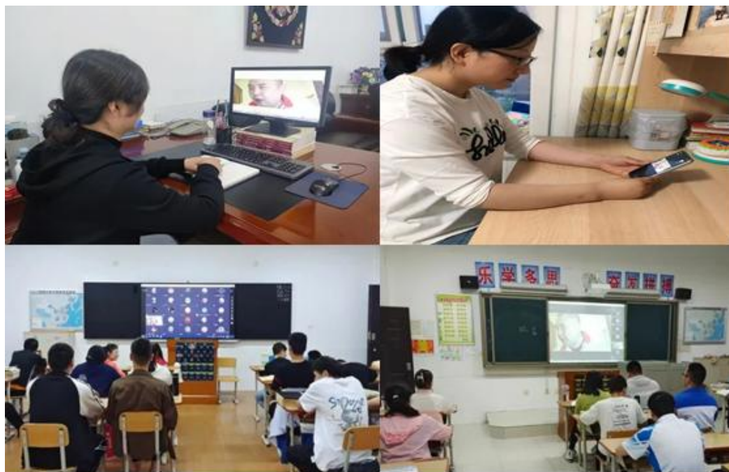
图 2-10 “让青春在奋斗中发光”励志专题讲座