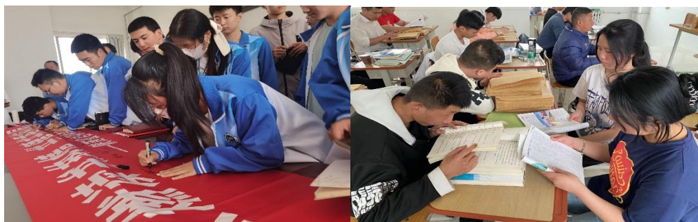
图 2-7 “点燃读书热情 共建书香校园” 读书日活动