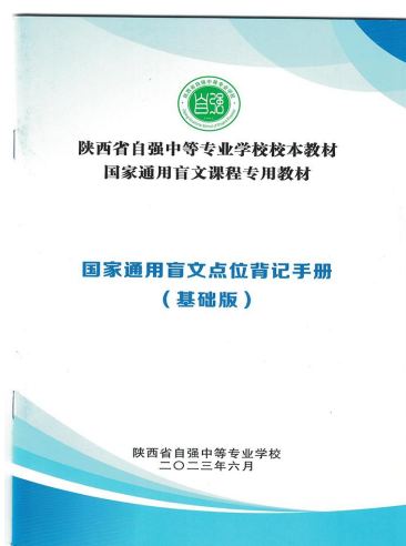
图 2-18 校本教材《国家通用盲文点位背记手册》（基础版）

学校坚持职业能力本位，鼓励教师开发适合本校实际和学生需求、体现了学校的残健融合办学特色和资源优势的校本教材。2023年，开发《党的二十大精神校本学习读本》数字化新型教材和校本专用教材《国家通用盲文点位背记手册》（基础版），目前已在全校范围内投入使用；中医康复技术专业校本教材《按摩手法集成》和《保健按摩》正在开发。