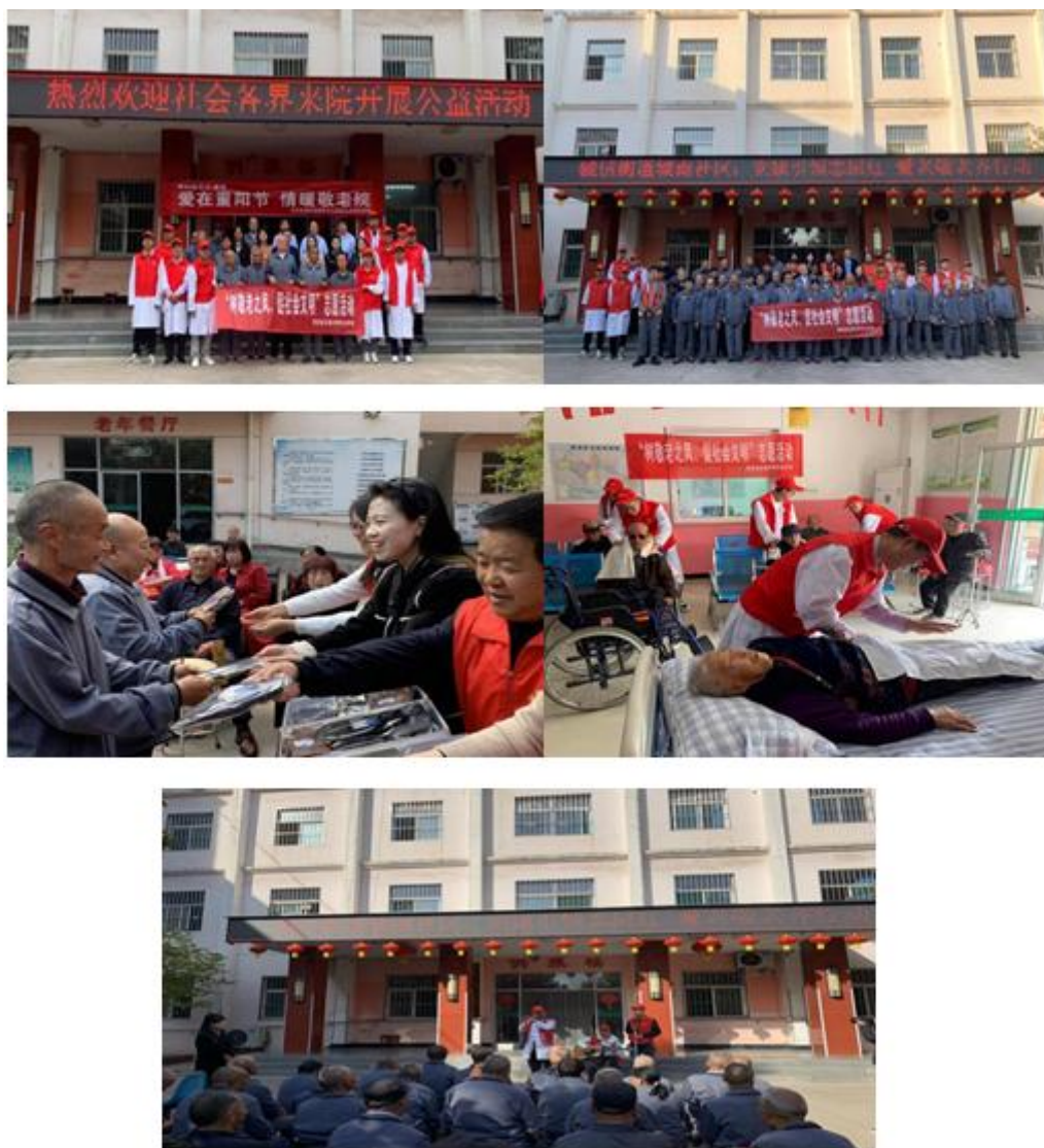
图 3-8 “树敬老之风、促社会文明” 志愿者服务活动