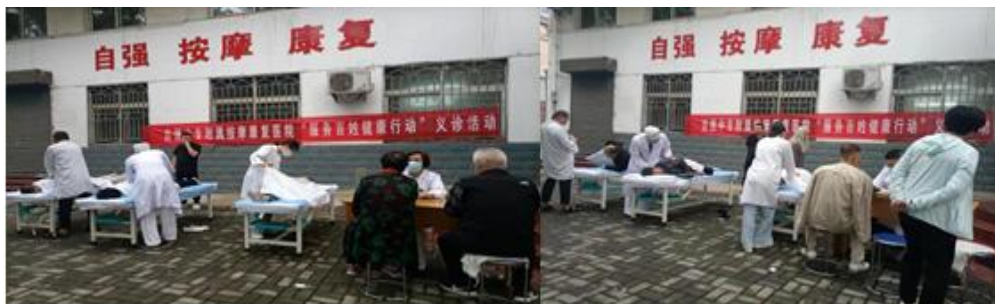
图 3-1 “服务百姓健康行动”义诊活动

广大患者提供量血压等基础测量服务。在慢性病管理及中医调理等方面为居民提供咨询建议，指导居民日常生活中的注意事项，并开展关于疫苗接种和医学知识的宣教活动。