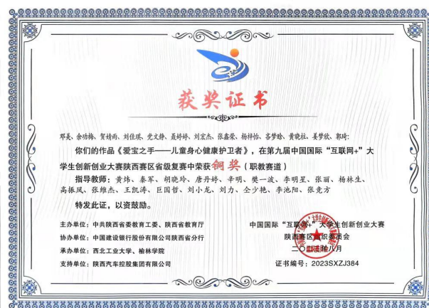
图 5-5 《爱宝之手——儿童身心健康护卫者》获铜奖