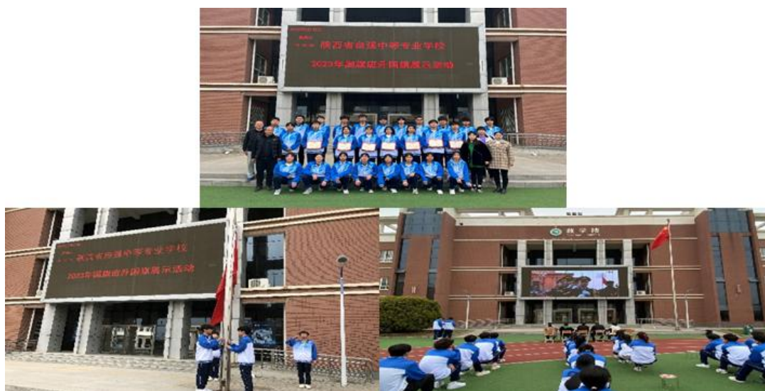
图 2-5 “心向国旗、展我风采” 升国旗展示主题活动

为深入学习宣传习近平新时代中国特色社会主义思想 and 党的二十大精神，弘扬爱国主义精神，进一步强化队伍正规化建设，增强集体主义观念，规范升旗仪式，学生科、团委组织我校国旗班队员开展了学习二十大——“心向国旗、展我风采”升国旗展示主题活动，展现了国旗班成员的责任感、使命感和团队精神，进一步激发同学们爱国爱党情怀。