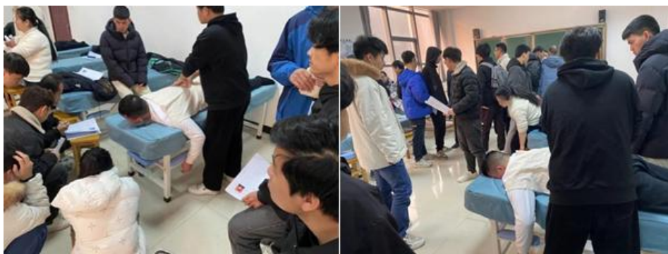
图 5-4 实习见面会

为确保学生岗位实习质量，实习期间，学校将定期安排实习检查，通过习训云平台管理、实地走访实习单位、举办实习生座谈会和查看实习生住宿环境等方式，了解实习生学习、工作和生活情况，强化实习生责任意识和安全防范意识，进一步提升学校岗位实习管理水平。