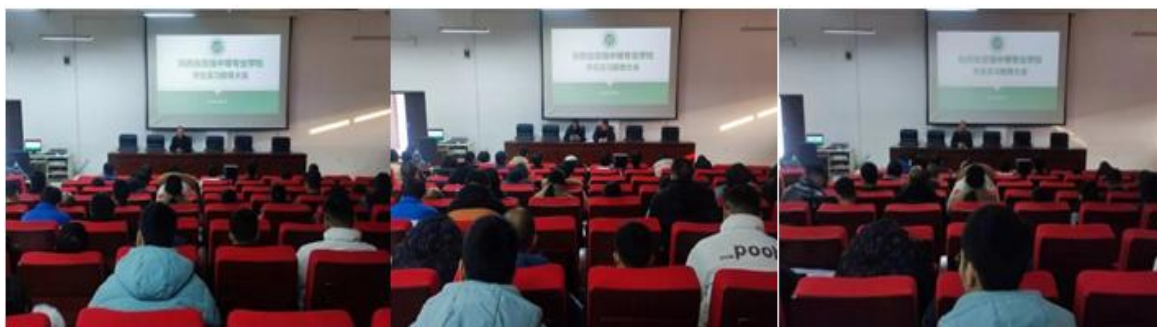
图 5-1 实习教育大会

家实习单位进行考察，先后召开学生实习教育大会、创业报告会、实习单位座谈会等，落实实习岗前教育和实习工作安排。各实习单位能够高度配合，严格落实岗位实习各项制度，经过面对面的双向选择交流会，学校、学生与实习单位签订三方协议并奔赴实习岗位。