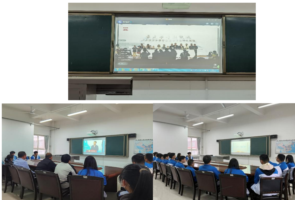
图 2-6 “最是书香静致远—陕西省青少年学生读书行动” 启动仪式