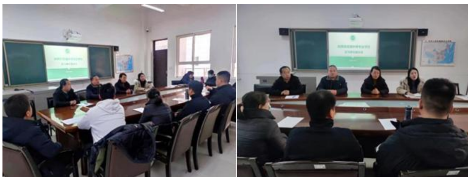
图 5-3 实习单位座谈会