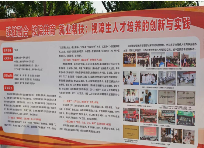
图 8-1 教学成果亮相职业教育国家级教学成果奖获奖成果陕西交流会