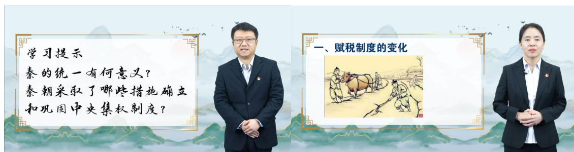
图 2-15 省级课程思政示范课程《历史》