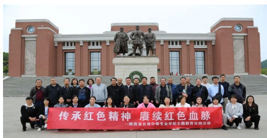
图 1-1 “传承红色精神 赓续红色血脉” 主题教育实践活动

工作做了细致安排，深入学习领会习近平总书记关于党的建设的重要思想，学习习近平总书记关于严肃党内政治生活的重要讲话和重要指示批示精神，学习习近平总书记关于以学铸魂、以学增智、以学正风、以学促干等重要论述，学习习近平总书记关于教育的重要讲话和重要指示批示精神，学习党章、新形势下党内政治生活若干准则等党内法规，按照读原著、学原文、悟原理，在学懂弄通做实上下功夫，在组织学习的同时，对发生在身边的典型案例进行了剖析、研讨、交流。5月，学校党委组织全体党员、入党积极分子、发展对象、中层以上干部及民主党派教师前往铜川陕甘边革命根据地照金纪念馆及薛家寨革命旧址开展“传承红色精神 赓续红色血脉”主题教育实践活动，接受红色教育，重温习总书记对陕西教育的关心关注之情。在抗美援朝战争胜利七十周年之际，为弘扬爱国情怀，传承伟大精神，凝心聚力，奋进新征程，11月，学校党委组织全体党员教职工观看爱国主义影片《志愿军：雄兵出击》。各支部利用“三会一课”、“学习强国”学习平台等形式，抓实支部党员经常性理论学习，组织参加了委厅“读好书、求新知、强本领”读书学习活动，4名党员教师分别获奖。