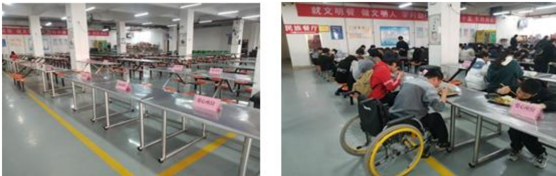
图 3-5 餐厅专用爱心座