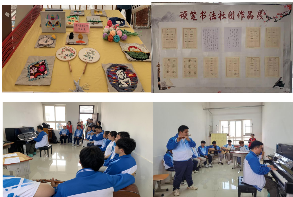
图 2-3 “社团展风采，筑梦正当时” 社团文化展示活动