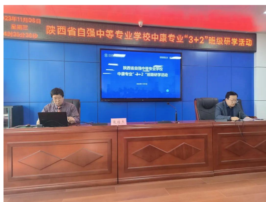
图 2-16 学生研学活动——“大健康 大康复 大发展”专题讲座

中医康复技术专业“3+2”班级 79 名学生在学校教务科、中康教研室、学生科等部门负责人带领下赴宝鸡职业技术学院中医药学院进行了教学交流和研学活动。活动分为教师座谈、学生讲座和实训室、中药标本馆参观三个环节。经过一系列的学习、参观，学生们在中职阶段对未来的发展方向更加明晰，中高职双方对 3+2 合作办学在教学、学生管理等各方面也进一步达成共识。