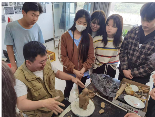
图 4-3 陶艺技能大师进校园

方法、捏塑方法、拉坯技术等知识，让学生感受陶艺发展在“一带一路”建设中的重要意义，通过手把手指导学生实践创作，学生深切地领略到中国传统陶艺文化的精髓和魅力。