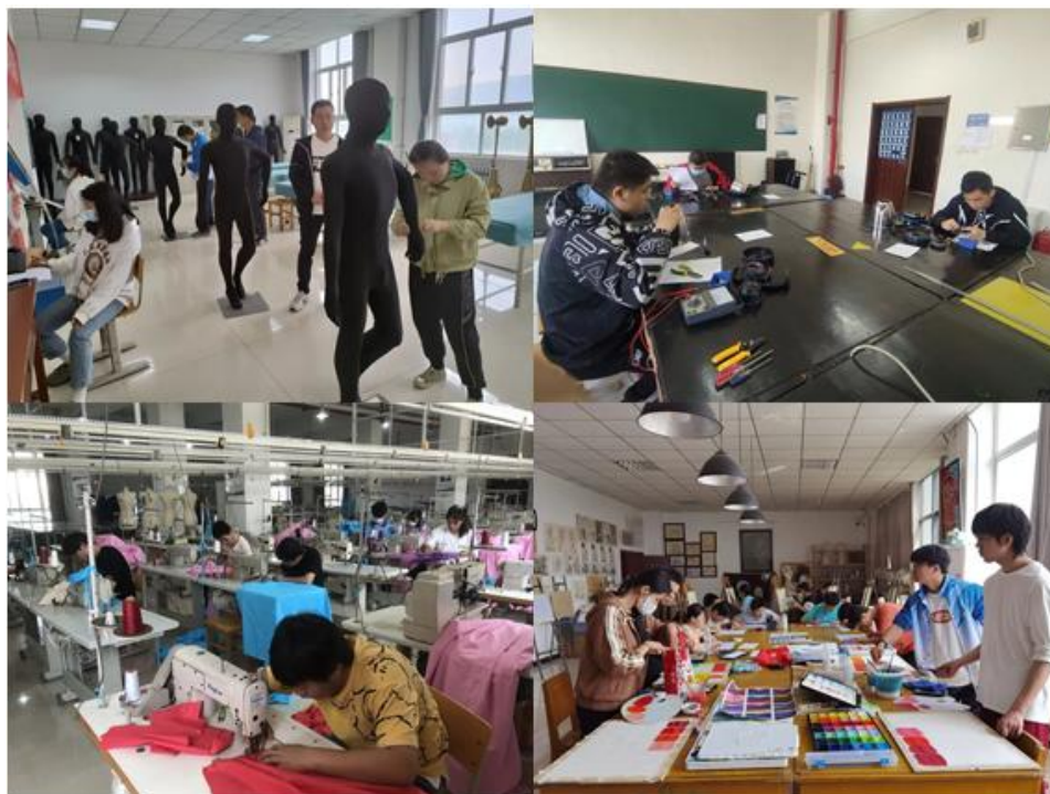
图 2-11 2023 年学生技能竞赛