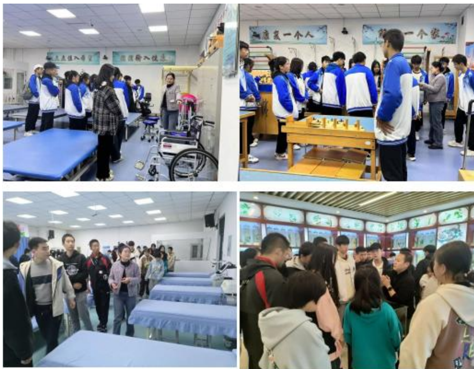
图 2-17 学生研学活动——参观实训室、重要标本馆