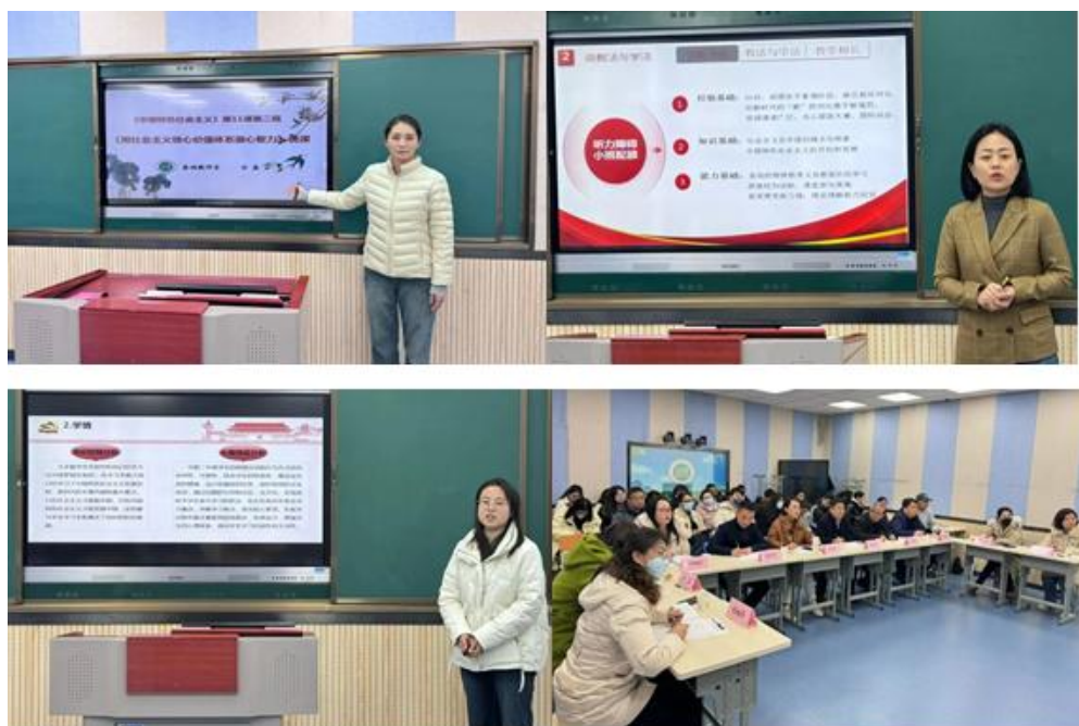
图 2-13 “同上一堂思政课”校级展示交流活动

学校紧抓思政课程建设“主战场”、充分发挥思想政治理论课的铸魂育人功能，创新思想政治教育方法。12月26日，学校召开“同上一堂思政课”展示交流活动。6名教师分别围绕《中国特色社会主义》、《习近平新时代中国特色社会主义思想学生读本》、《职业道德与法律》、《经济政治与社会》、《哲学与人生》等课程充分挖掘思政课程的育人价值，从说教材、说教学目标、说教学重难点、说教法学法、说教学过程、说板书设计等几个方面进行说课。老师们独到的教学设计，巧妙的信息化教学手段，新颖的教学方法，将教学目标和育人育德巧妙的结合起来，展示了良好的教师素质和教研能力。