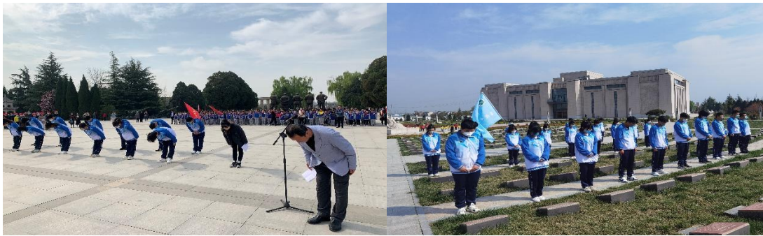
图 4-4 “缅怀革命先烈、弘扬民族精神”主题祭扫活动