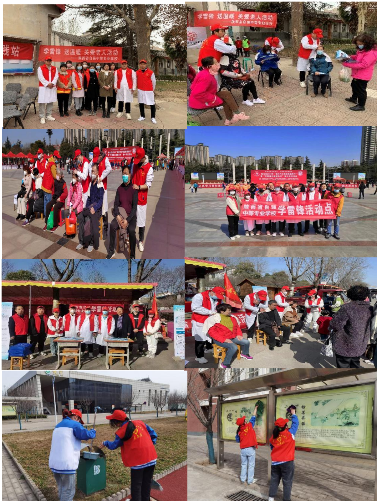
图 3-6 “学雷锋、献爱心” 志愿者服务活动