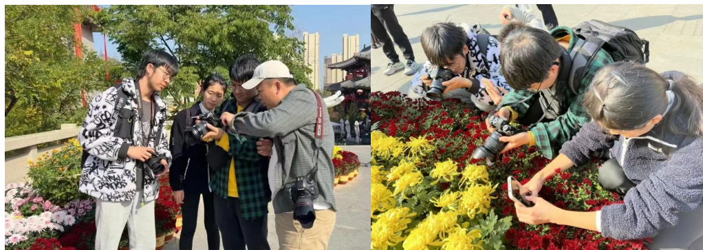
图 2-4 工艺美术专业师生开展摄影实践教学

学校鼓励教师组织形式多样的户外实践活动，让学生走出校园，拥抱自然，体验一堂堂别开生面的户外课程。2023 年，工艺美术专业教师带领部分学生前往中华石鼓园等地进行摄影实践创作活动，现场讲解摄影技巧和注意事项，同学们徜徉在花的海洋，精心构图取景，用手中的相机将一个个美的瞬间定格。户外实践创作既能丰富学生的学习生活，提高摄影专业技能水平，又能提升了学生的综合素养。