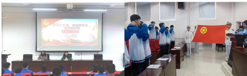
图 2-2 2023 年新团员入团仪式暨表彰大会

2023年，校团委召开了“学习二十大、永远跟党走、奋进新征程”新团员入团仪式暨表彰大会，为学校团组织输入了新鲜的血液。2022—2023学年，校团委面向全体团员开展主题团课十余次，内容包括学习团章、党的二十大报告全面解读、新时代青年精神素养提升等，团课的开展全面提高了全体团员自身素质，增强了全体团员的责任感和使命感。