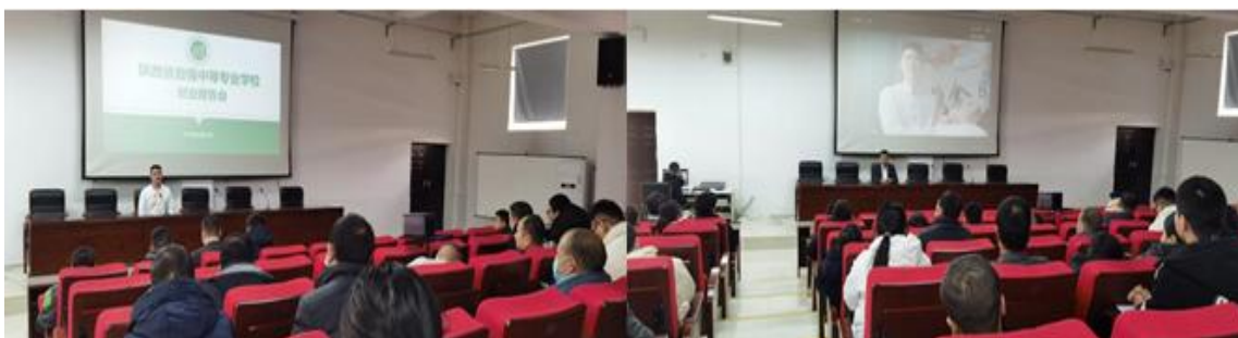
图 5-2 创业报告会