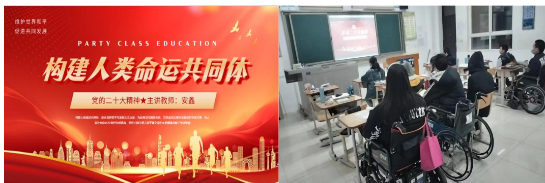
图 8-6 “党的二十大精神”进课堂