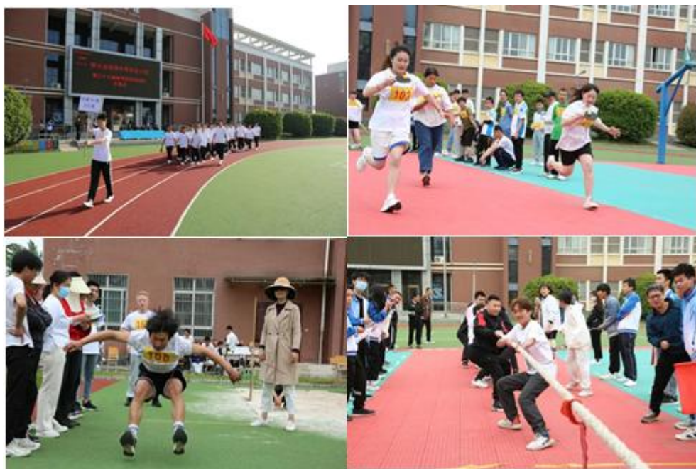
图 2-9 第三十七届春季田径运动会

生平等参与社会文化生活的能力，展现特教中职学生超越自我、自强不息、的良好精神风貌。